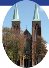
Onbevlekt Ontvangen Amstenrade